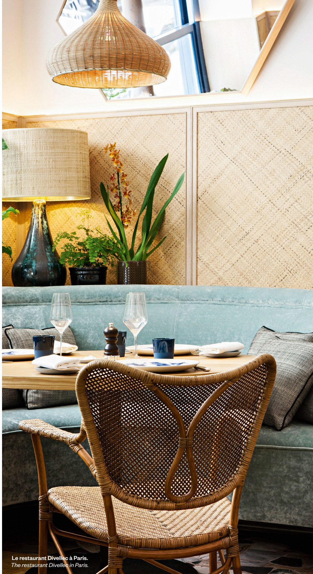
Le restaurant Divellec à Paris. The restaurant Divellec in Paris.

With the opening of the Yves Saint Laurent museum in Marrakech, 2017 promises to be a big year for Studio KO. The structure exemplifies Karl Fournier and Olivier Marty's approach to Moroccan architecture, with contemporary-style blocks rising up from the ochre earth. To the north, their palette takes on more color and warmth, without becoming too elaborate, as seen in a recently completed London apartment and a house in Los Angeles—not to mention the legendary restaurant Divellec in Paris. Meanwhile, their shop for Balmain is opening in New York, to be followed soon by another in L.A. o.p.