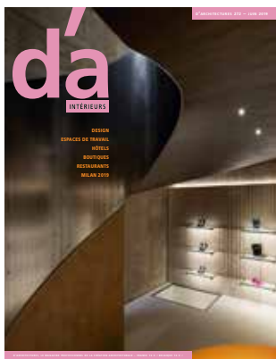
En couverture : 23 Old Bond Street, Londres. Architecture et design : Stella McCartney. Photographie : Hufton+Crow